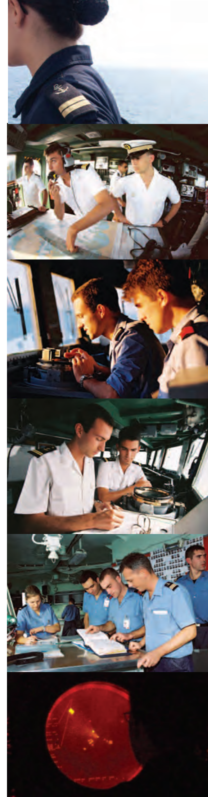
Edition 2013 - Document non contractuel - Crédits Photos : Marine nationale